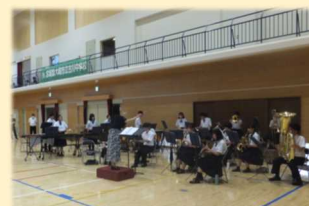
壮行式で演奏を披露(吹奏楽部)