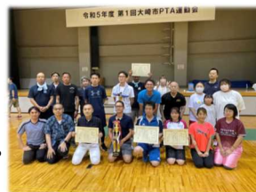
優勝しました! 古川Bチーム

8月6日(日)、田尻総合体育館において、大崎市PTA運動会が4年振りに開催されました。今回は黎明中PTAと合同チーム「古川Bチーム」を編成し、運営委員の方を中心に参加しました。当日はボッチャ、ラダーゲッターなどの種目が行われました。そして、古川Bチームは各種目で高得点を重ね、見事総合優勝することができました。笑い声と歓声が絶えない楽しい時間を過ごすことができました。